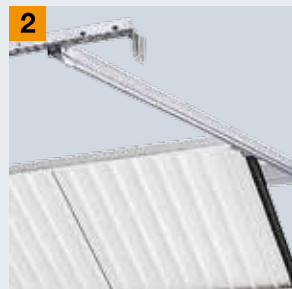
Rail de guidage au plafond